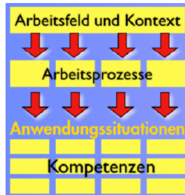
Aufbau des Berufsprofils

Dem vorliegenden Rahmenlehrplan liegt der in der nachfolgenden Abbildung dargestellte Aufbau zu Grunde: